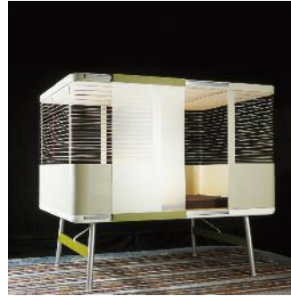
Aération douce par renouvellement d'air double flux, Prototypes VIA Élément du projet « Terroirs déterritorialisés » Design : Philippe Rahm Carte Blanche VIA, 2009