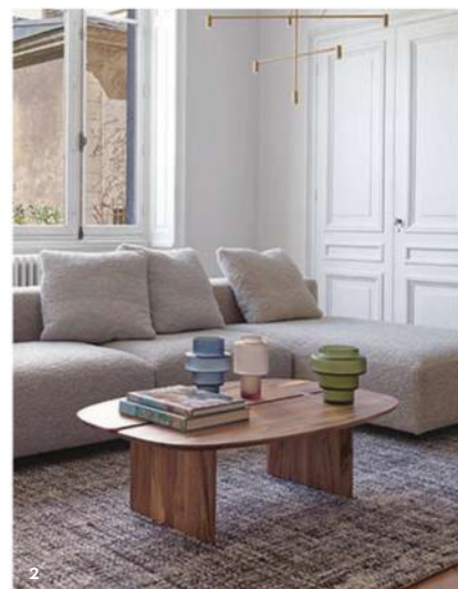
1/ Table d'appoint Pembroke en chêne massif (ToolsGalerie, 2022). 2/ Table basse Intervalles en bois massif (Ligne Roset, 2021).