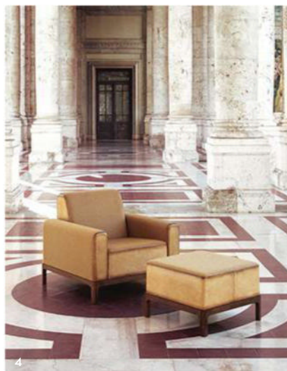
3/ Prototype de la chaise CD10 (La Chaise Française, 2023). 4/ Fauteuil et repose-pied de la collection « Swann » en cuir Venezia (Berluti, 2021).

J'étais un peu gêné de rejoindre Berluti après ma collaboration avec Hermès, même si nous n'avions plus de projets ensemble. Je me posais des questions. J'ai d'abord dit non à une première sollicitation. Deux ou trois ans après, j'ai été amené à rencontrer les gens de Berluti grâce aux éditeurs Domeau & Pères et je me suis penché sur ce qu'ils voulaient développer dans le domaine de l'art de vivre. Le challenge était intéressant. C'était l'évolution d'une histoire en train de s'écrire. Quels codes de la maison emprunter pour les retranscrire sous la forme d'objets ? Au début, j'ai travaillé avec Kris Van Assche à la direction artistique. J'ai pris plaisir à collaborer avec un styliste de cette trempe, c'était une expérience nouvelle pour moi. J'ai rencontré quelqu'un avec une grande sensibilité au design et qui faisait bien la différence entre ses collections de mode et ce qu'on allait proposer pour les meubles.