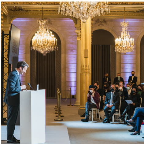
Monsieur Emmanuel MACRON Président de la République française Discours prononcé à l'occasion de la cérémonie de remise du prix

« La remise du prix Le FRENCH DESIGN 100 , c'est le rendez-vous annuel de toute une corporation : un véritable rituel, un moment-clé propulsé par le design français. Il ne célèbre pas uniquement les 100 meilleurs projets de design et d'architecture d'intérieur français dans le monde, mais rend également hommage à tout cet écosystème que nourrissent des designers, des fabricants, des savoir-faire uniques... autant de composantes essentielles à notre art de vivre à la française. »